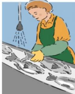
Processamento de Alimentos