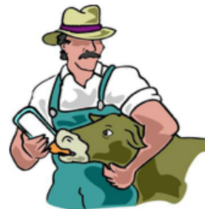
Indústria de Laticínios