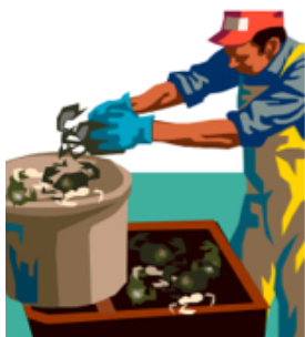
Processamento de Pesca

2. Você ou alguém de sua casa está trabalhando , procurando trabalho ou já trabalhou por pelo menos um dia em alguma das seguintes indústrias abaixo?