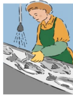
Perparation de Aliments