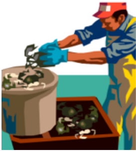
Traitement du Posson

2. Travaillez-vous, recherchez-vous un emploi ou avez-vous travaillé pendant au moins une journée dans l'un des domaines suivants?