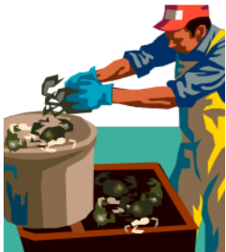
Industrie des Produits de la Pêche

2. Travaillez vous actuellement ou cherchez vous du travail dans l'un des secteurs suivants?: