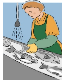
Procesamiento de Alimentos