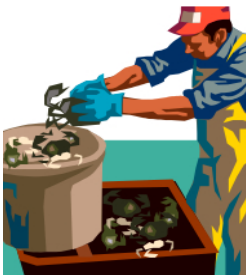
Procesamiento de Pesca

2. Actualmente esta usted trabajando o buscando trabajo en las siguientes industrias?: