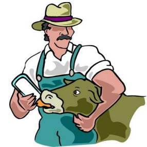
Indústria de Laticínios