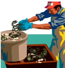
Processamento de Pesca

2. Você está atualmente trabalhando ou procurando trabalho nas seguintes indústrias?: