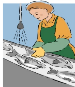
Processamento de Alimentos